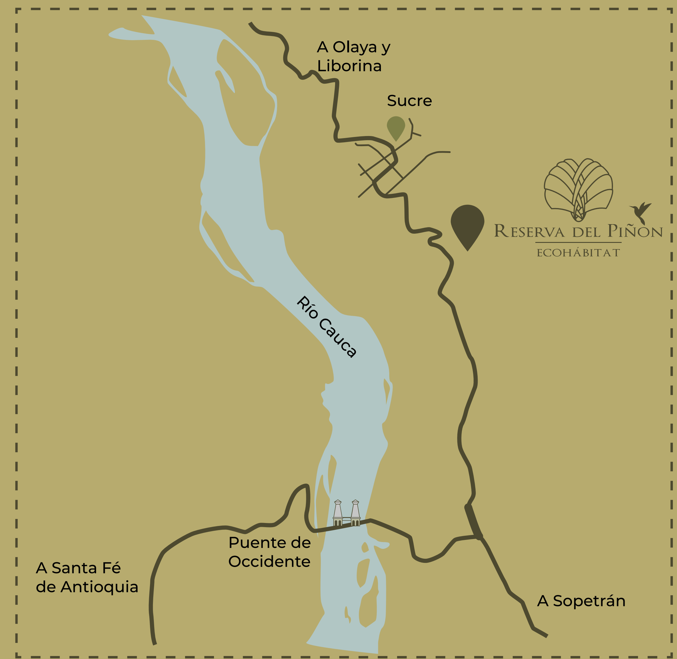
Plano de ubicación